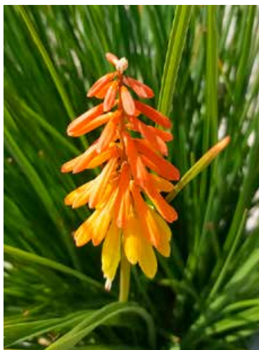
Kniphofia 'Mango Popsicle' (vuurpijl)