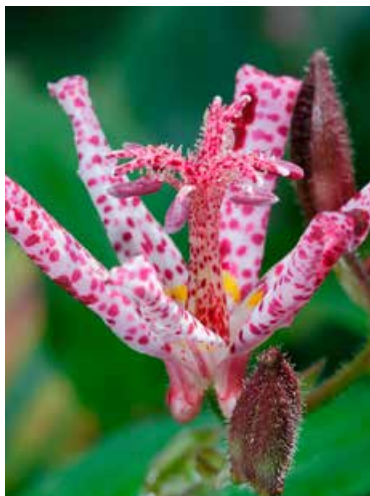
Tricyrtis formosana (paddenlelie)