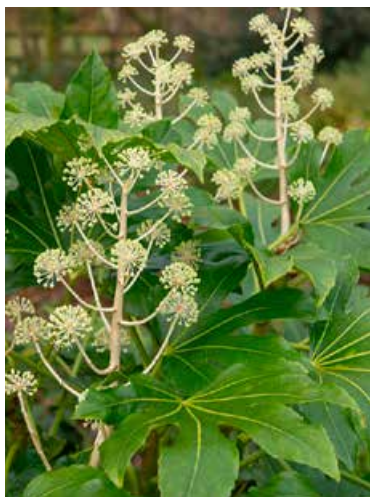
Fatsia japonica (vingerplant)