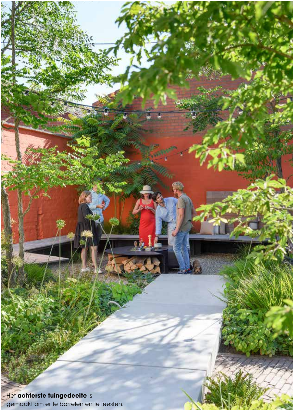
Het achterste tuingedeelte is gemaakt om er te borrelen en te feesten.

‘Het meest geslaagd is, dat het een belevinstuin is en dat het iedere maand een andere beleving is.’