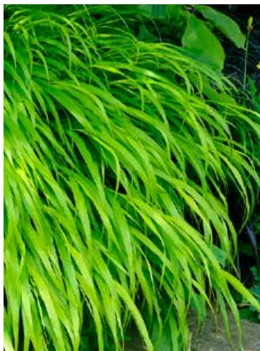
Hakonechloa macra (Japans berggras)