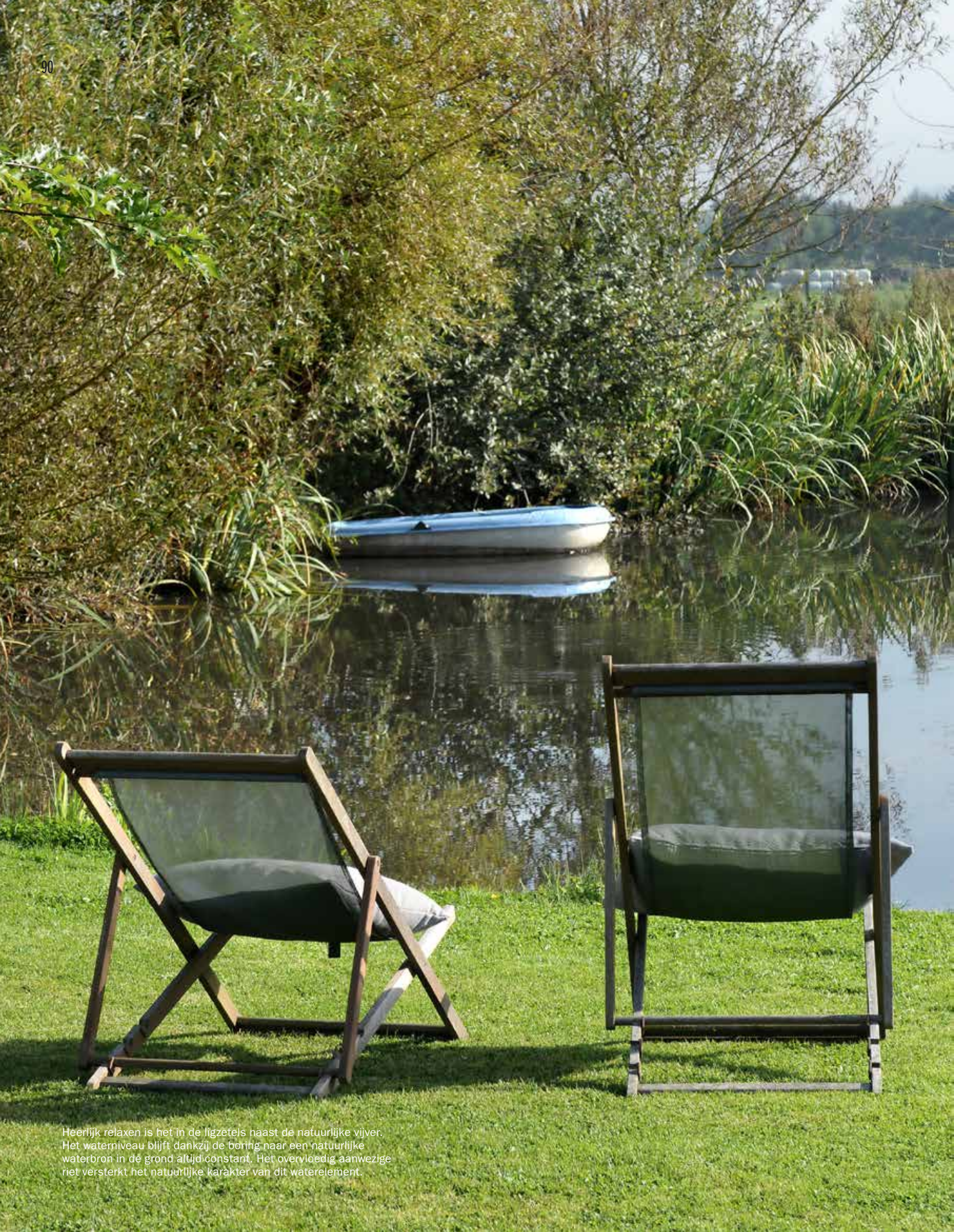
Heerlijk relaxen is het in de ligzetels naast de natuurlijke vijver. Het waterniveau blijft dankzij de boring naar een natuurlijke waterbron in de grond altijd constant. Het overvloedig aanwezige riet versterkt het natuurlijke karakter van dit waterelement.