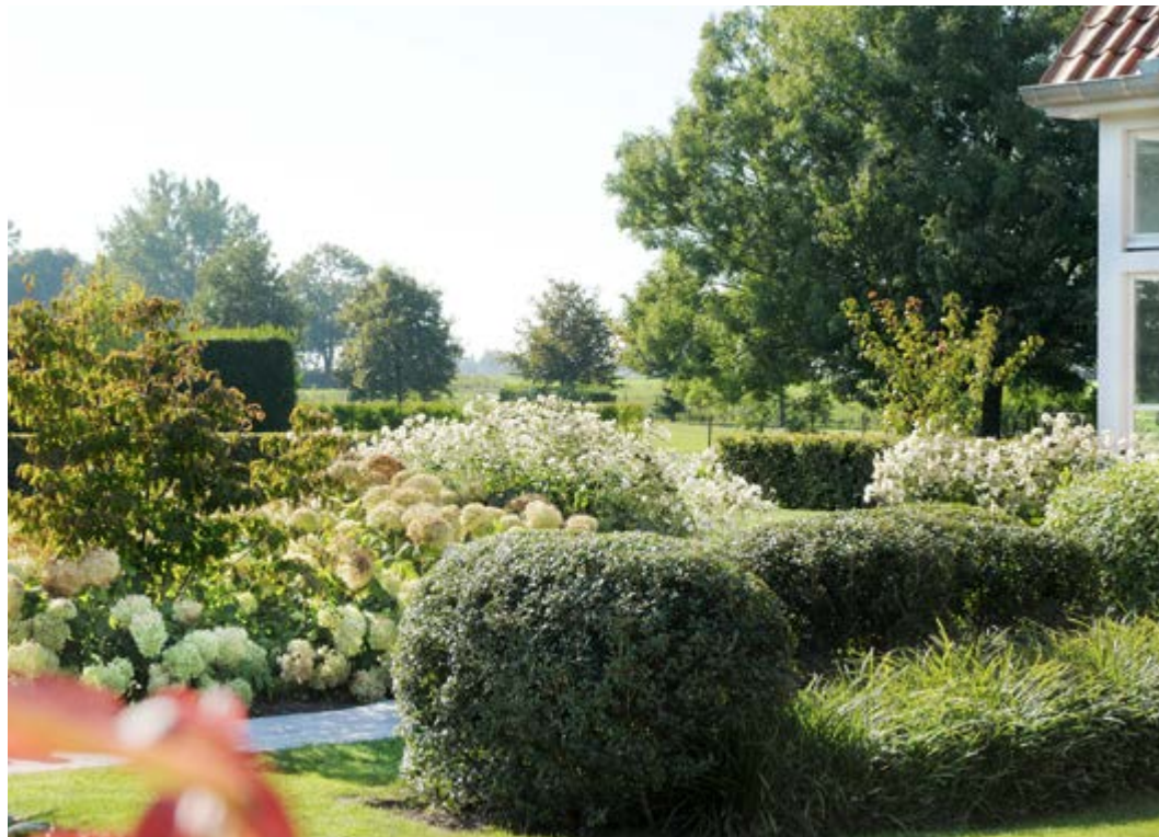
Foto onder: een eerder besloten tuindeel met gesnoeide wolven van Osmanthus, Carex, hortensia's en herfstanemonen. Links staat een mooie Cornus kousa 'Chinensis', een echte eyecatcher in de vroege zomer en herfst.