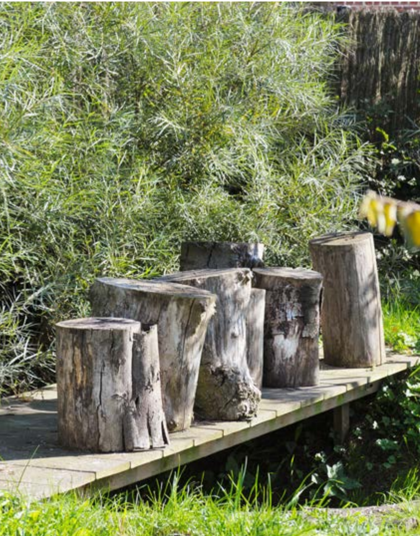
Een apart deel in de tuin met natuurlijke speelelementen, zoals een brugje, boomstammen en een speelbos van olijfwilg.